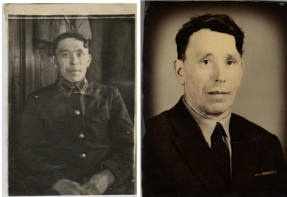
На снимках Сизых И.И.